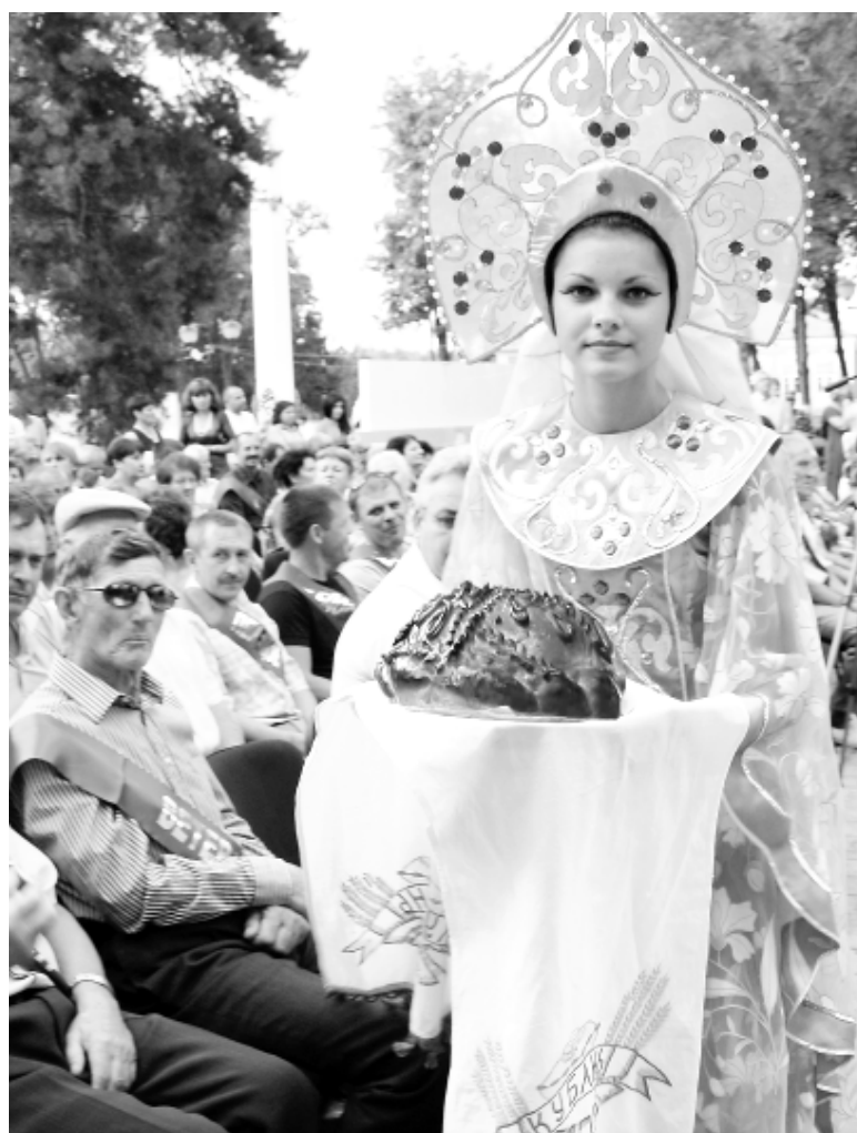
● На празднике урожая каждый желающий мог отведать испеченный каравай.