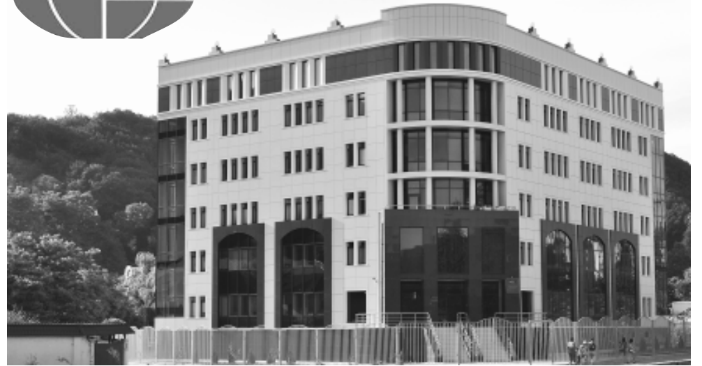
● Так выглядит здание налоговой инспекции в Туапсе, построенное руками работников ЗАО «Глобус».

- Без этого сегодня невозможно. Наше предприятие постоянно развивается. Начали мы с гидроизоляционных, общестроительных и антикоррозионных работ, с возведения кровли. Сейчас ведем монолитное строительство. На объектах активно внедряем самые современные композитные материалы, приобретаем новую технику. На вооружении предприятия сейчас имеется 38-метровый автобетонный насос, позволяющий подавать бетон в любую точку строящегося здания, а также погрузчики и другая современная техника. Осенью мы намерены приобрести новое оборудование, в частности, буровые установки. Это позволит нам перейти на сооружение свайных фундаментов, которые будут применяться при строительстве жилья в Адлерском районе Сочи. Внедрение современных механизмов позволит сэкономить на людских ресурсах и значительно облегчить труд работников.