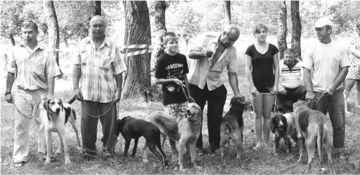
● Торжественное построение участников выставки со своими питомцами превратилось в настоящее показательное выступление четвероногих охотников.