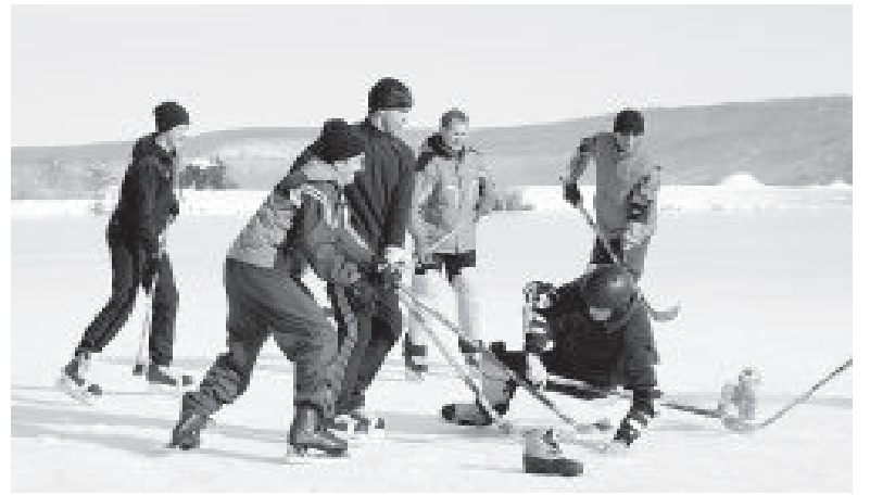
● Вот уж действительно, трус не играет в хоккей.