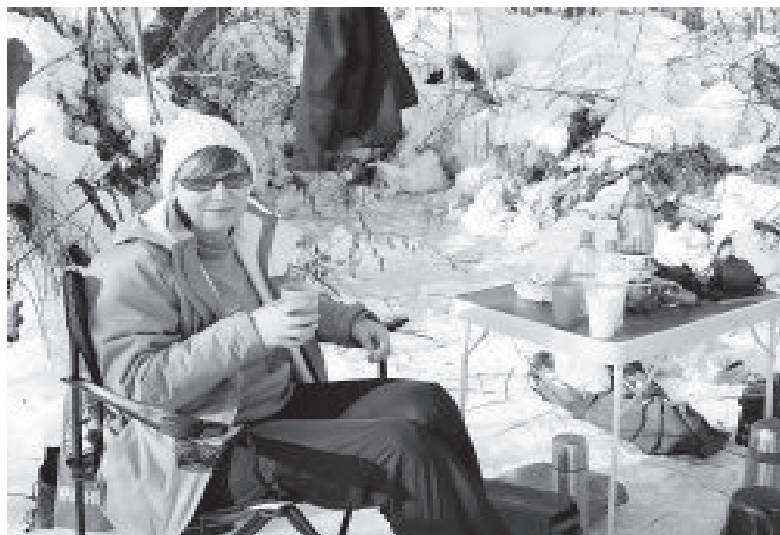
● По традиции в перерыве между хоккеем и катанием на коньках - горячий чай.