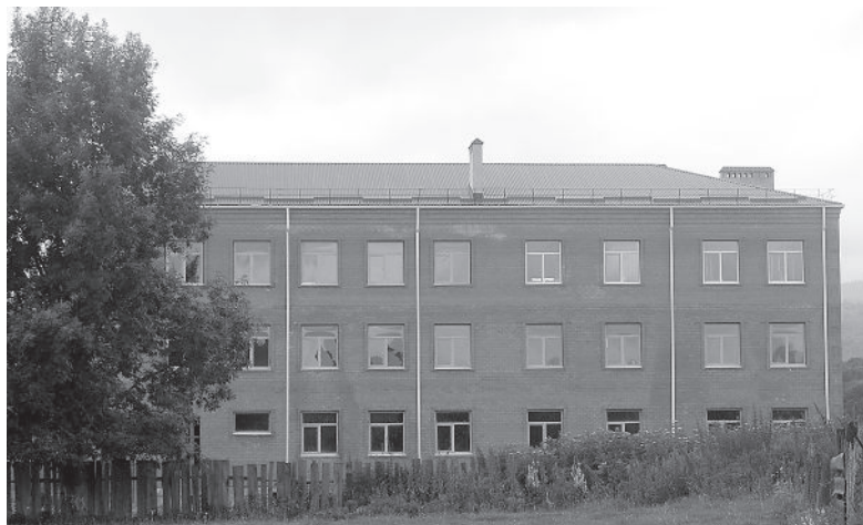
● Строится новая школа.

лась пологая гора, на которой расположилось сельское кладбище. С тех пор она называется Кладбищенской горой. С северной стороны - трехглавая гора Шаханы.