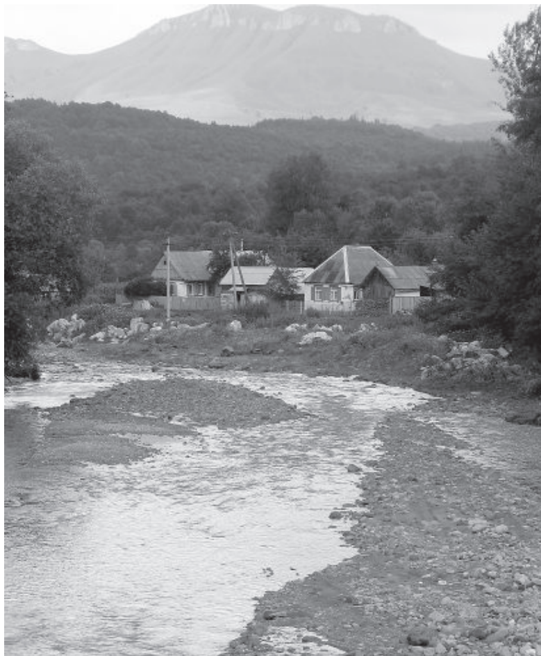
● Красота здесь – не описать!