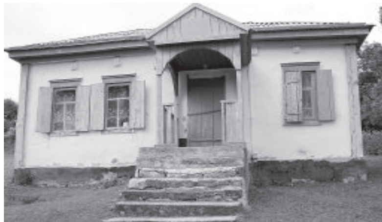
• Зданию библиотеки точно нужны перемены.

А вот пойдут ли по нашим стопам дети - это только им решать. Обычно все родители хотят, чтобы дети продолжали их дело, но такое бывает достаточно редко, ведь у них иной, свой, взгляд на жизнь и на то, как ее надо прожить. Подростут - препятствовать какому бы то ни было выбору мы не будем. Захотят в город - поедут и обоснуются там.