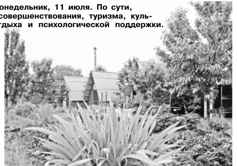
● Уютная территория базы отдыха «Диана» утопает в зелени деревьев и кустарников, создавая радующую глаз атмосферу.