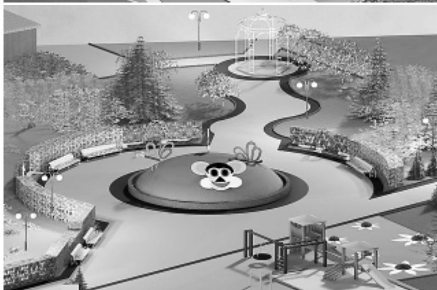
● Так будут выглядеть зона отдыха и детская игровая площадка в обновленном парке поселка Мостовского.