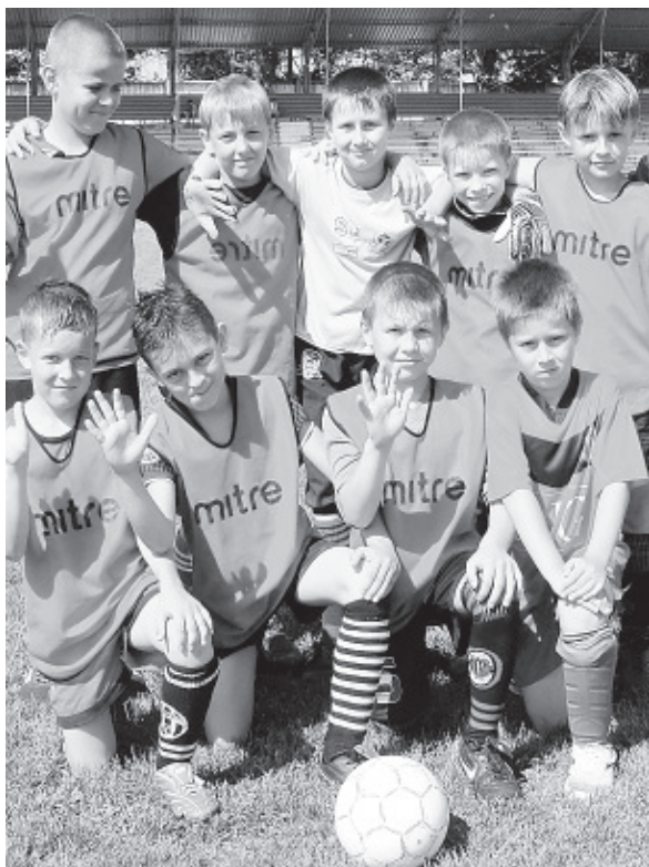
● Команда «Кубань». Возможно, именно эти ребята в будущем станут чемпионами.