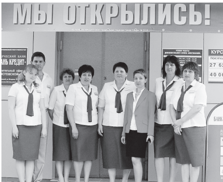
На правах рекламы.

На днях в поселке Мостовском состоялась торжественная презентация дополнительного офиса банка «Кубань Кредит», которая стала очередным этапом развития и расширения его региональной сети. Дополнительный офис «Мостовской» - это пятидесятое представительство банка на Кубани.