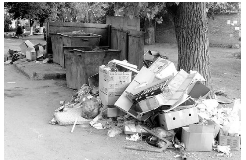
● Вот такую картину часто можно наблюдать там, где стоят баки с мусором.

- К сожалению, не всем мостовчанам хватает сознательности и гражданской ответственности, чтобы не мусорить или подождать мусорной машины, которые работают по графику, особенно в частном секторе. Администрацией увеличено количество баков в микрорайоне Энергетиков с