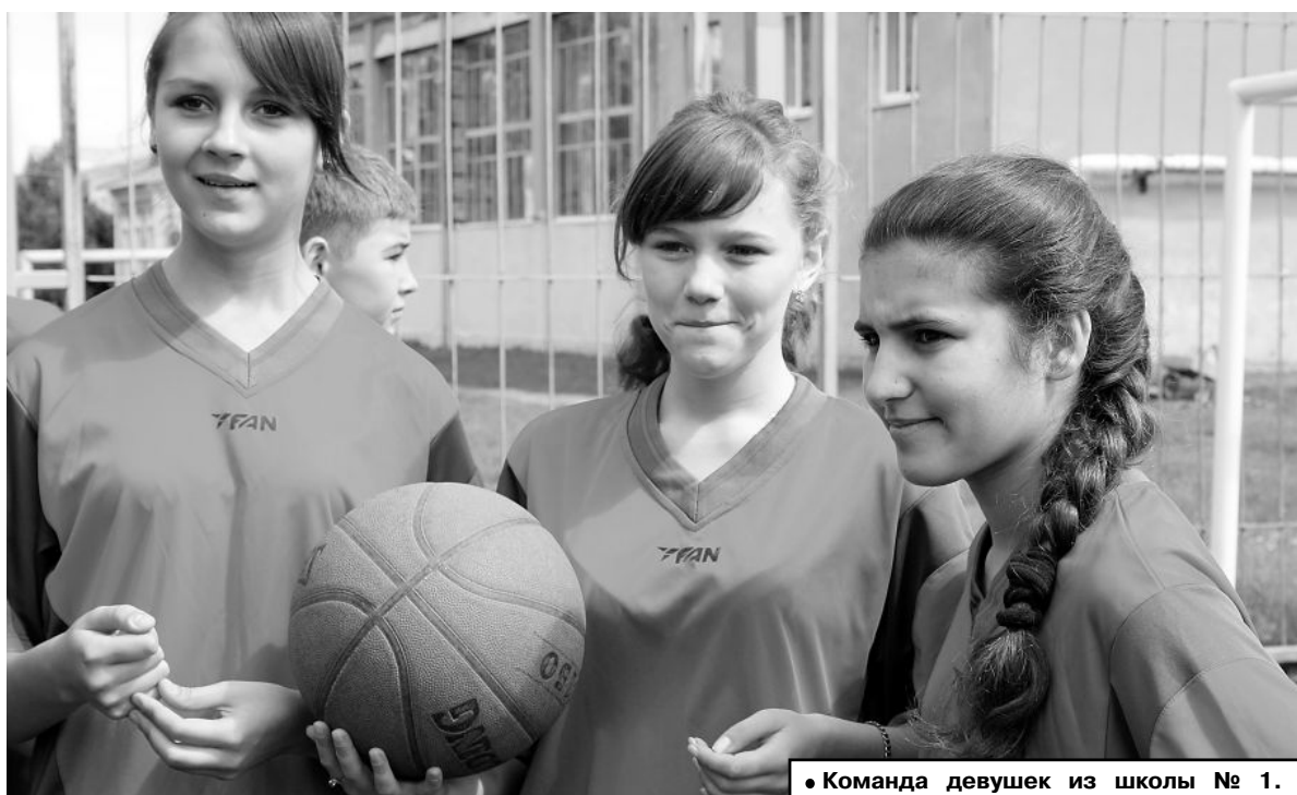
• Команда девушек из школы № 1.

7 июня, в четвергом номере газеты «Предгорье», мы опубликуем полный календарь игр Евро-2012. И как бы ни сыграла наша сборная, смотрите футбол с удовольствием!