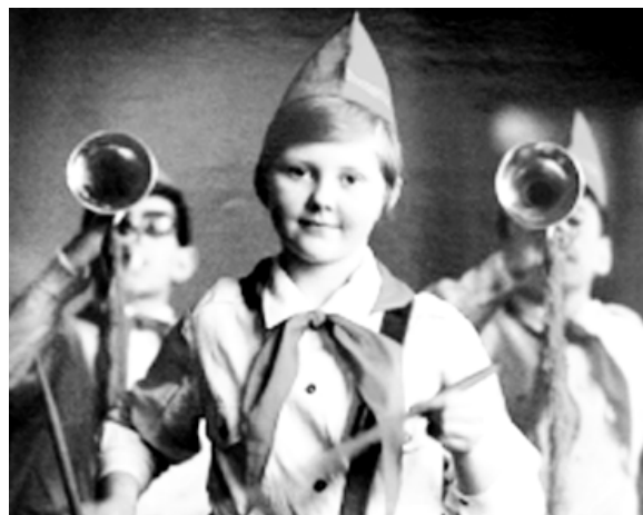
● Пионеры 70-х XX века.

В 90-х годах в России сторонниками коммунистических идей были воссозданы немногочисленные новые пионерские организации.