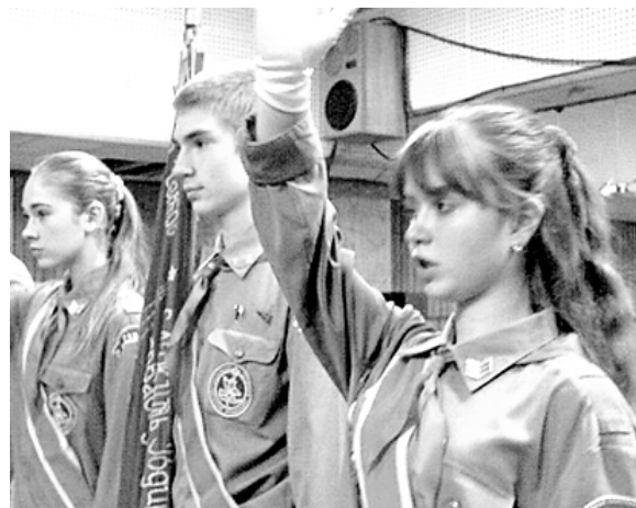
● Пионеры XXI века.