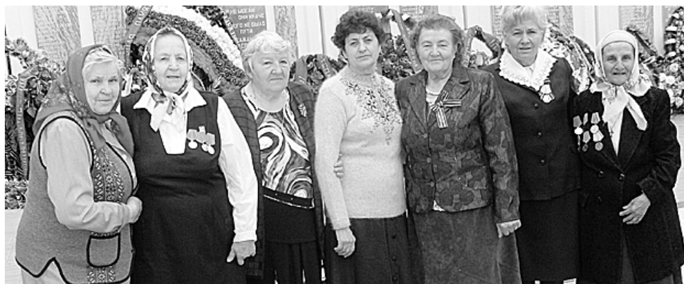
● Пенсионеры, посещающие дневное отделение, вместе проводят не только будни, но и праздники. Нынешний День Победы не стал исключением.

Более подробную информацию можно получить по адресу: п. Мостовской, ул. Мира, 3, или по тел.: 5-41-30.