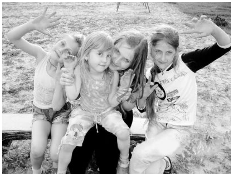
• Формула счастья сестренок Нацинец: дважды два - четыре.

- Наши родители тоже придерживались такого воспитания, - говорит она, - и я считаю, что это правильно. Ребенок с детства должен понимать, что хорошо, а что плохо, и если провинился, значит, должен нести ответственность за свой проступок. Но