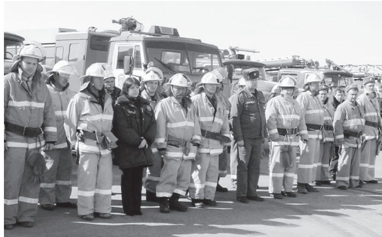
● Каждый рабочий день у пожарных начинается с построения.

В пожарной охране России сложились славные традиции: любовь к профессии, проявление отваги, взаимопомощи при исполнении служебного долга. В основе этих традиций лежат замечательные черты