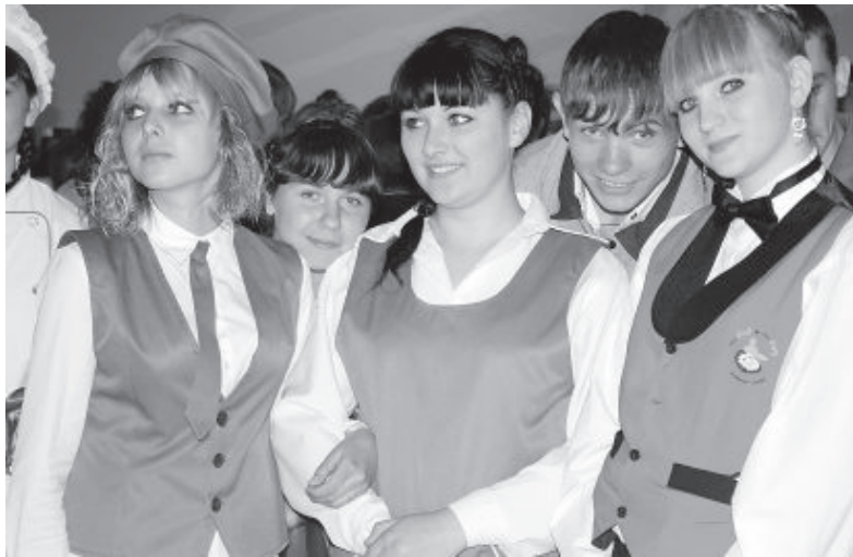
• Студенты профессионального училища № 43 города Лабинска на ярмарке вакансий привлекали к себе внимание яркой спецодеждой.

Не сказать, чтобы все происходящее сильно интересовало наших школьников. Некоторые из них, а таких нашлось немало, пройдя для порядка круг по танцевальному залу, выждав для приличия еще минут десять-пятнадцать, потянулись к выходу. Но здесь сотрудники центра занятости предусмотрительно выставили свои кордоны и не выпускали ребят, объясняя им, что гости специально приехали для них издалека, что подождать от силы надо полчаса. Всеми правдами и неправдами уговаривали школьники отпустить их. Многие ссылались на чрезмерную занятость. Да, дела, дела... И ничего, что если бы не ярмарка вакансий, париться бы им еще урока два. Но непреклонны были жестокосердые работники центра занятости.