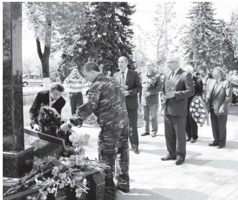
● Возложение венков и цветов к памятнику погибшим чернобыльцам в Мостовском.

- Наша организация имеет одну важную отличительную особенность. Нет больше такой организации в крае, в которой было бы такое число награжденных высокими правительственными наградами. 19 че-