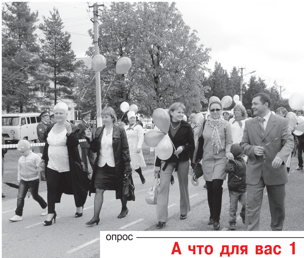
Фото из архива редакции 2011 г.

Стоит отметить, что в этом году негласное состязание на самую массовую первомайскую демонстрацию объявлено в некоторых регионах страны. Власти возрождают советскую практику. При этом шествиям стараются придать аполитичный характер. По некоторым данным, по всей России с демонстрациями на улицы выйдут около трех миллионов человек.