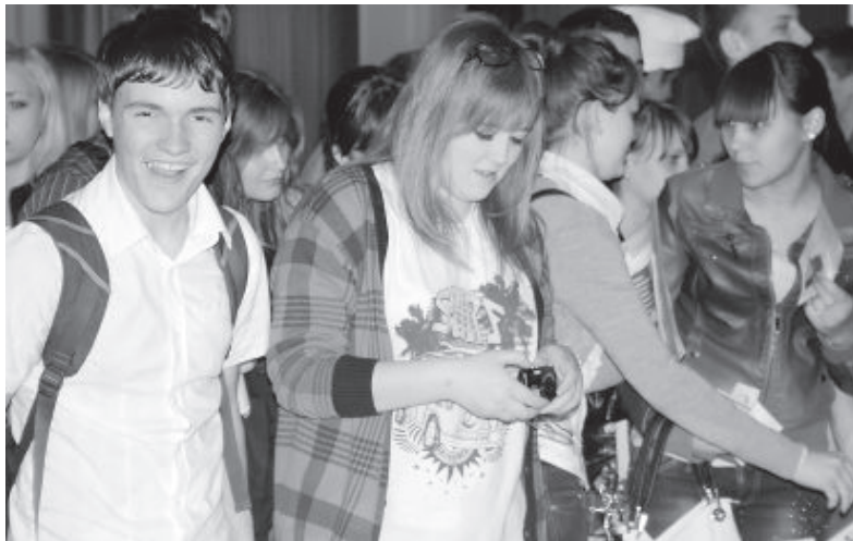
• Заинтересовать чем-нибудь нынешних школьников дорогого стоит.

Что ж, раз на солнечную волю не отпускали, следовало как-то переждать это мучительное время. Спасались от безысходности и скуки по-разному. Очень выручали собранные со стендов буклеты с информацией. Их, например, можно было свернуть и постучать ими друг друга по голове.