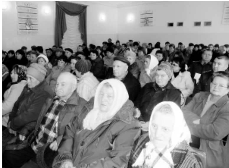
● Жители Шедка в стороне от общих дел не остаются, поэтому на сходы приходят и стар и млад.

Нашел понимание среди большинства детей и родителей Закон Краснодарского края № 1539-КЗ «О профилактике безнадзорности и правонарушений несовершеннолетних в Краснодарском крае». Ежедневно осуществляется дежурство рейдовых групп, работа которых координируется в штабе, расположенном в шедокском Доме культуры. За