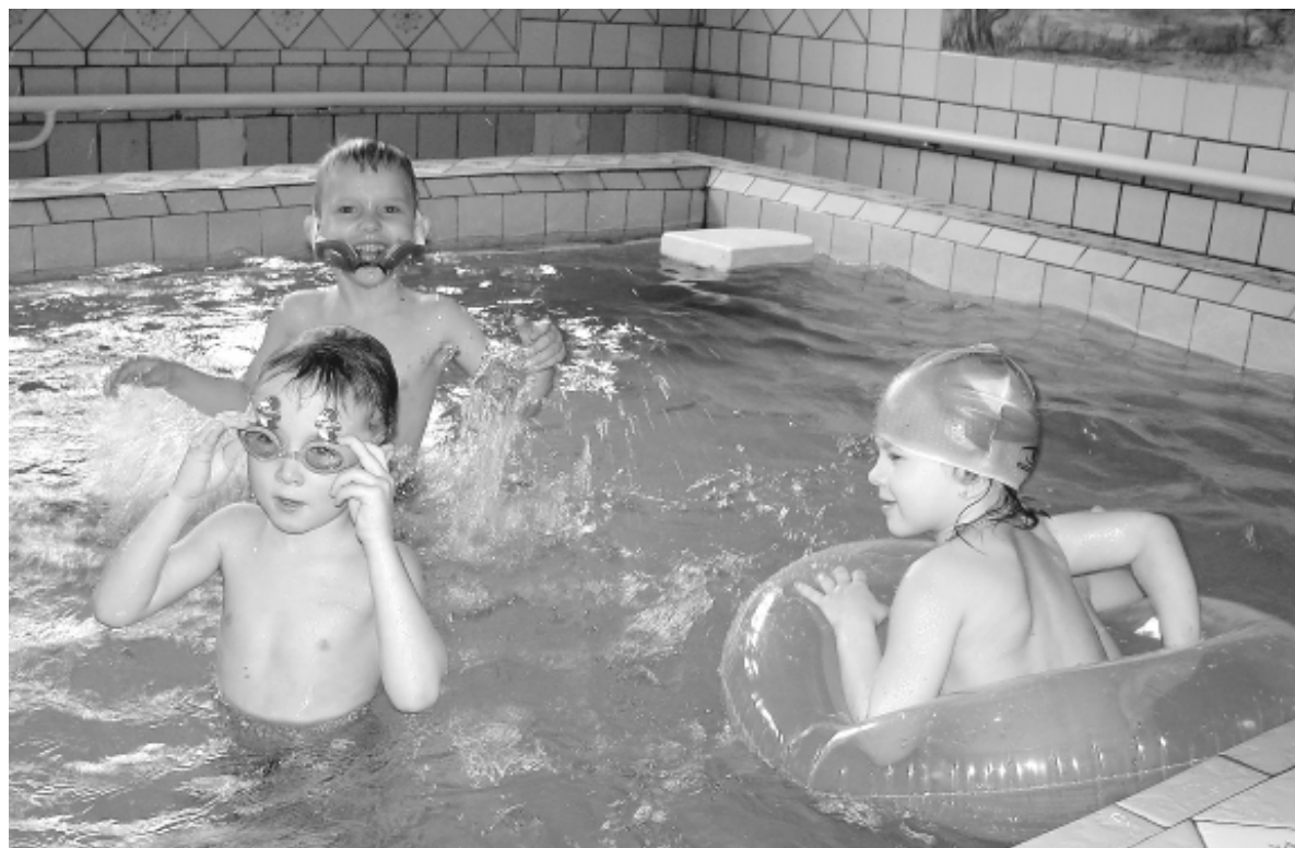
● Один-единственный детский сад в Мостовском районе может похвастать бассейном - это «Березка».