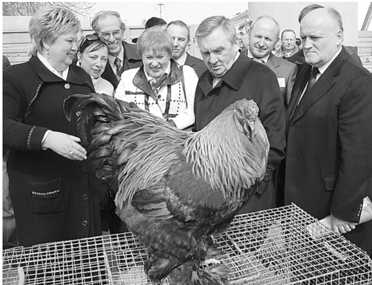
● Председатель Законодательного собрания края Владимир Бекетов перед совещанием по традиции посетил выставку продукции, представленной предприятиями и личными подвоями Белореченского района.

Закон о местном самоуправлении работает - это доказали законодатели Кубани и власть на местах.