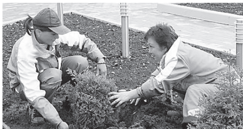
● Озеленители «Чистого поселка» знают толк в клумбах да в цветниках.

В этом году администрацией Мостовского городского поселения закуплено 3 900 саженцев цветов петунии и бегонии, чтобы обновить цветочные клумбы в парке Победы - у Вечного огня и на парковых цветниках. В скором времени они снова начнут радовать нас своим неповторимым видом.