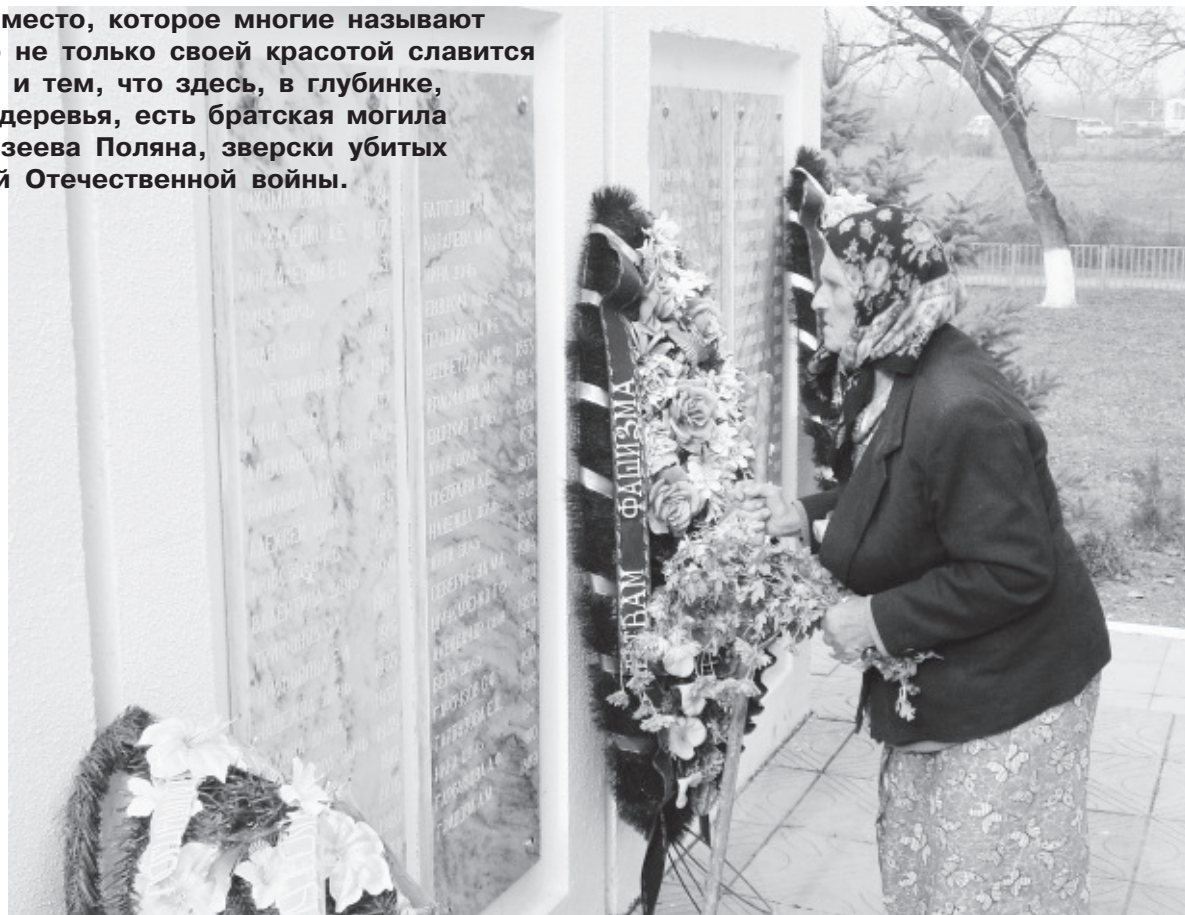
● Гордостью, славой и вечной скорбью овеян в Махошевской мемориальный комплекс в честь погибших в годы войны и расстрелянных мирных жителей поселка Михизеева Поляна.