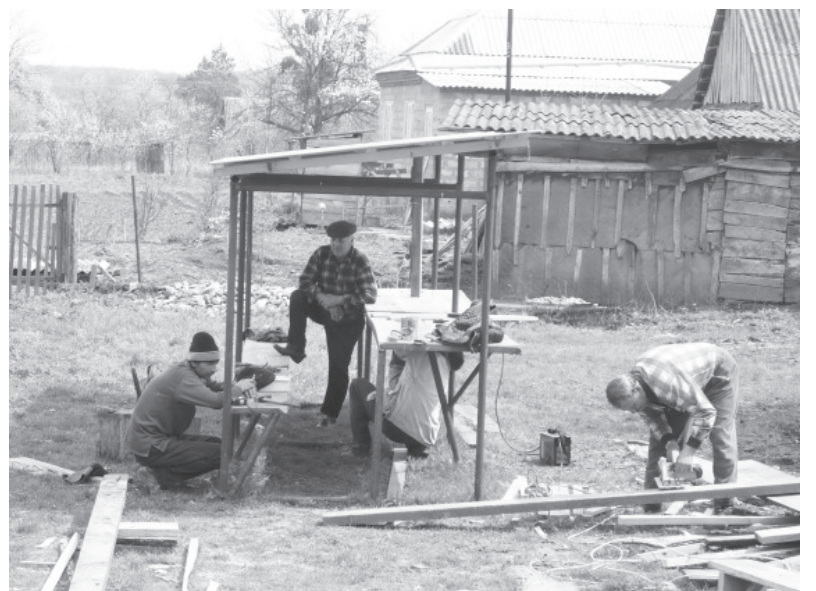
● Строительство рынка для реализации излишков сельхозпродукции жители вели собственными силами.