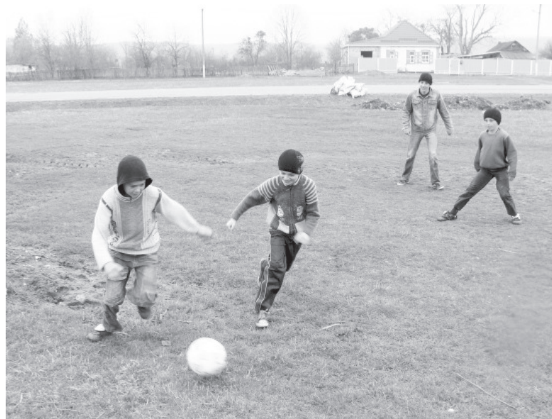
● Махошевские мальчишки мечтают стать членами сборной России и принять участие в чемпионате мира по футболу в 2018 году.