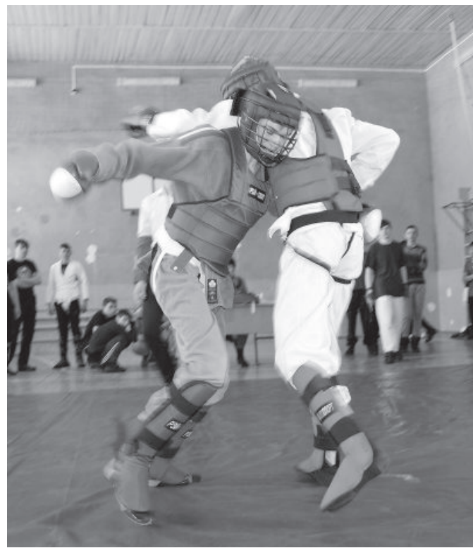
Спортивные новости подготовил Дмитрий БУНТУРИ.

Победители и призеры турнира получили дипломы. Теперь по его итогам будет сформирована команда Майкопского казачьего отдела, которая в апреле примет участие в войсковых соревнованиях по армейскому рукопашному бою. После утомительных поединков восстановить силы юным казакам помог вкусный обед.