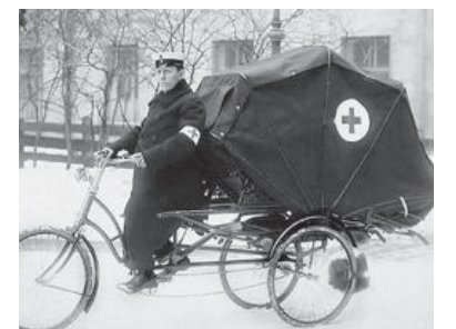
● Одна из первых карет скорой помощи в Санкт-Петербурге (1916-1918 годы).