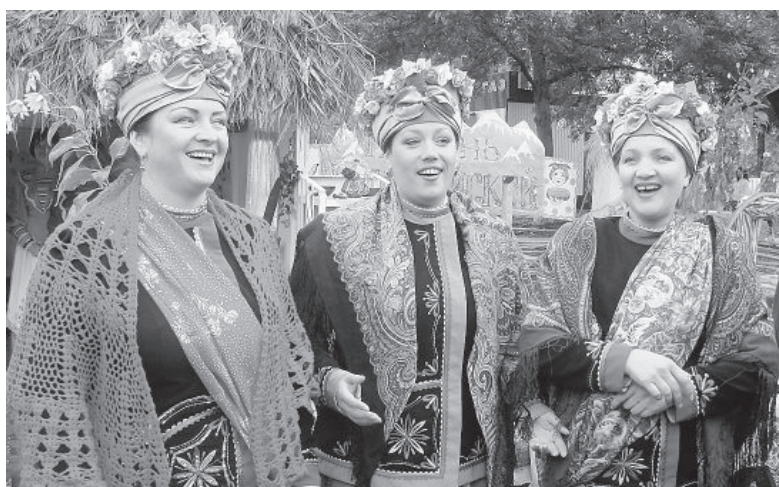
● «Лель» - участник всех районных мероприятий.