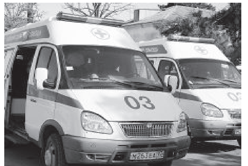
● Сегодня на помощь людям спешат семь машин скорой помощи и один реанимобиль.

Итак, скорой помощи Мостовского района исполнилось 48 лет, а сама история ее возникновения уходит в далекое прошлое, во времена глубокой древности. У человека всегда возникала потребность помочь тому, кого поразила несчастная случай.