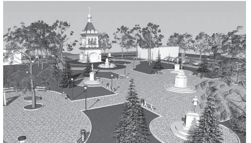
● Так будет выглядеть комплекс в ближайшее время.