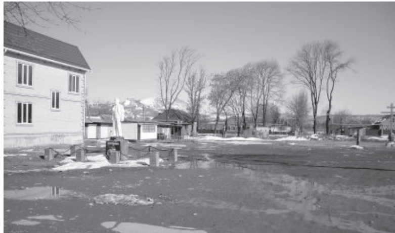
● Вот так выглядит центр поселка сейчас.

Обращаемся ко всем жителям Псебая, Мостовского района, псебайцам, проживающим в других регионах края и страны, с призывом принять участие в строительстве комплекса, который станет культурным центром поселка, местом отдыха и праздников, украсит Псебай.