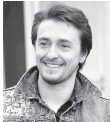
● Сергей Безруков.