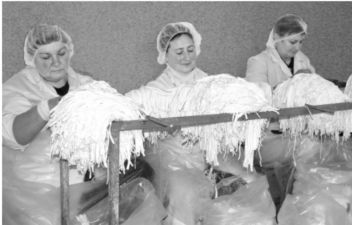
• Сырных дел мастеров из ООО «Авокадо» отличает профессионализм и душевный подход к своему делу.