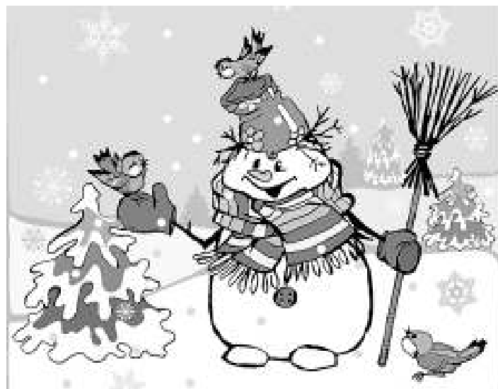
• Старый Новый год - загадочный русский феномен, который иностранцам понять практически невозможно.