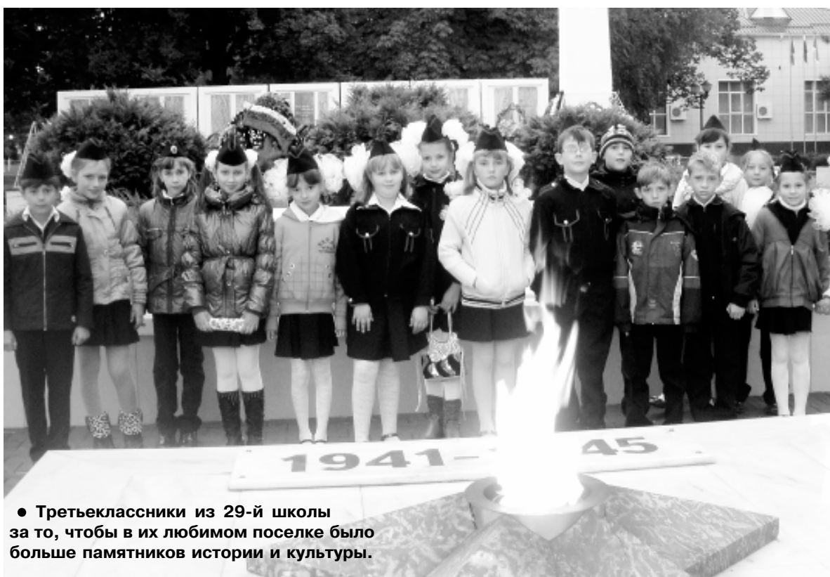
• Третьеклассники из 29-й школы за то, чтобы в их любимом поселке было больше памятников истории и культуры.

Уж так сложилось, что этот день мы пышно и радостно отмечаем в сентябре. Это по традиции. Но если заглянуть в календарь исторических и памятных дат, праздничных дней и знаменательных событий, то впервые Мостовский район был образован 2 июня 1924 года. Через четыре весны и зимы он был упразднен, а вся его территория вошла в состав Лабинского района. С одноименным названием наш район был вновь образован 31 декабря в 1934-м. Затем еще несколько раз его упразднили и учреждали вновь. Окончательно и бесповоротно Мостовский район был образован 21 февраля 1975 года. Тогда же поселок Мостовской стал его районным центром. И так, послезавтра нашему району исполняется 36 лет.