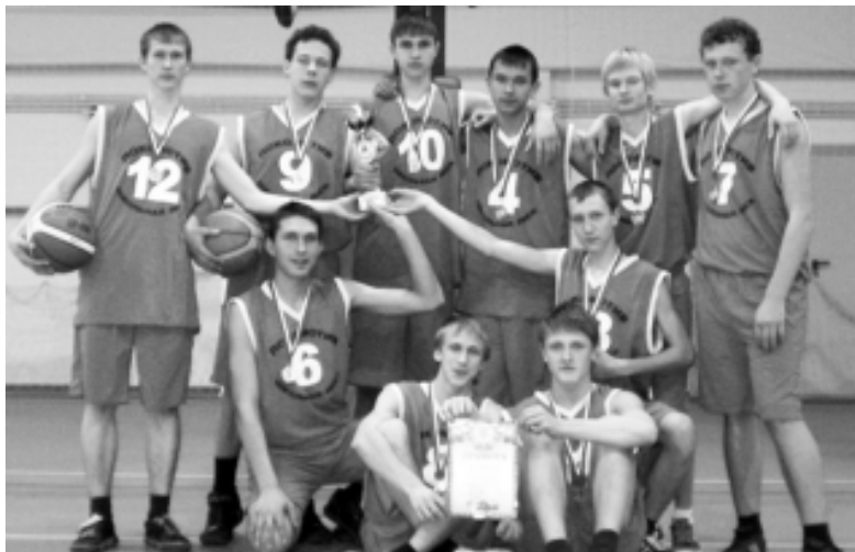
● Серебряные призеры краевого зонального турнира ЮФО по баскетболу «Локомотив - школьная лига» 2011 года.

Юноши СОШ № 14 в третий раз подряд становятся чемпионами Мостовского района и представляют наш район на краевом уровне. Мостовский район входит в Юго-