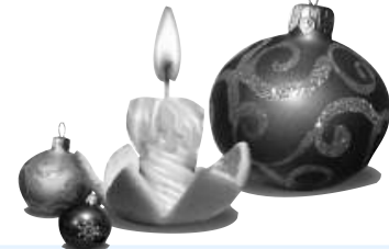
График работы почты в праздники

Для обеспечения бесперебойного обслуживания мостовчан во время новогодних праздников Почта России установила особый режим работы отделений почтовой связи в период с 31 декабря 2011 года по 10 января 2012 года.