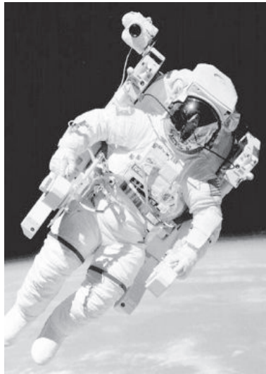
Космонавты много времени проводят в барокамере, в которой создается давление, отличное от атмосферного.

На Земле существуют специальные тренажеры, имитирующие невесомость. На них космонавты учатся правильной координации движений.