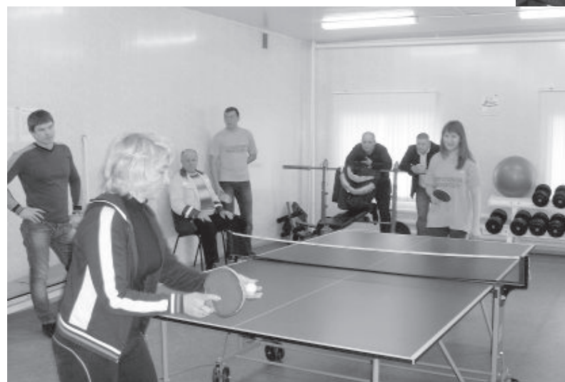
● Игра показала полное равенство в мастерстве друзей-соперников.