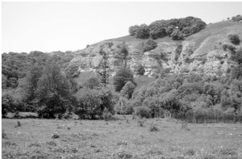
● Особенно хороша природа Псебая летом.

Продолжается конкурс «Десять лучших мест для отдыха». Мы приглашаем вас, дорогие наши читатели, рассказать об уже полюбившихся всем гостям и жителям района и о еще не ведомых никому великолепных местах для отдыха. Ждем ваших рассказов (можно с фотографиями). Лучшие из них будут опубликованы. Десятку самых-самых определит читательское голосование. Победители получат призы. Ждем ваших писем и откликов по адресу: ул. Набережная, 66, или по электронной почте - mostpred@mail.kuban.ru. А сейчас предлагаем вашему вниманию рассказ одного из наших читателей о поселке Псебай.