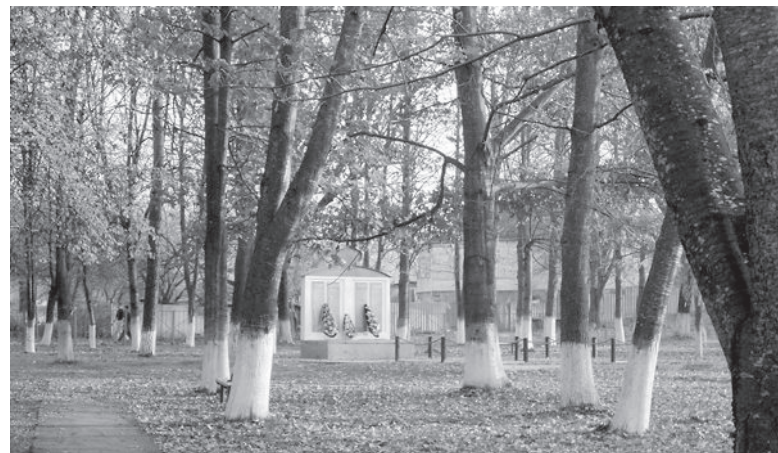
● Станичный парк. Памятник андрюковцам, погибшим в годы Великой Отечественной войны.