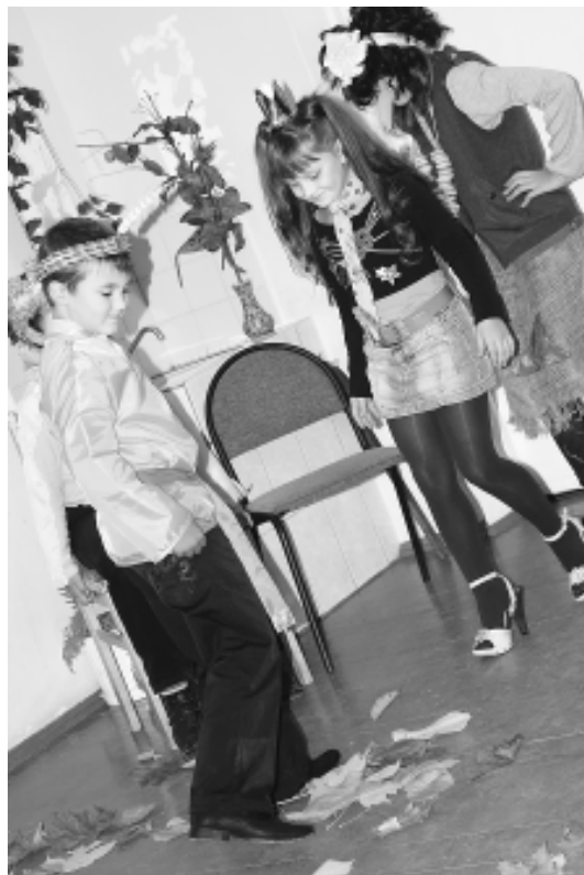
● Сцена из музыкальной сказки о Царе Горохе с участием учащихся 26 класса.