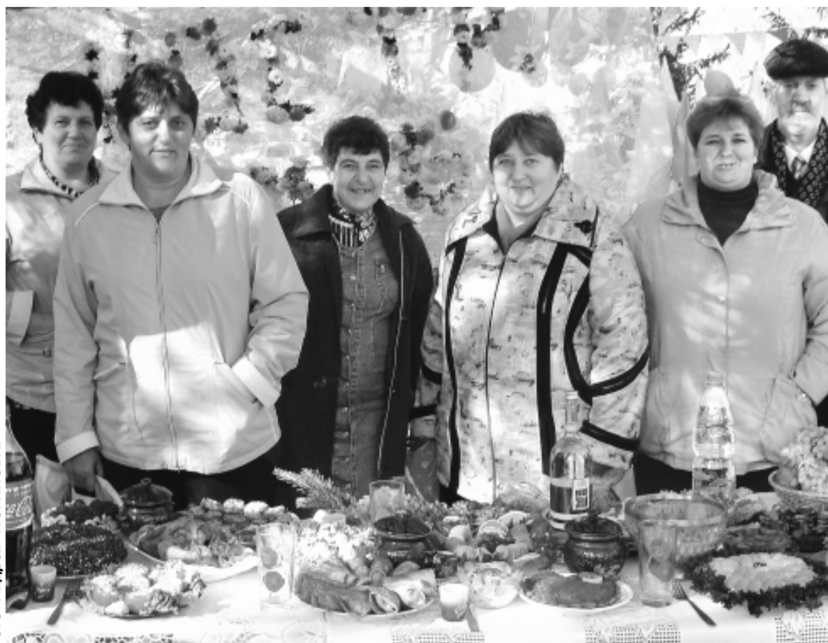
Школы, детский сад, больница, Дом культуры представили на суд станичников и гостей праздника свои поделки и кулинарные изделия. Вот уж тут было раздолье фантазии!