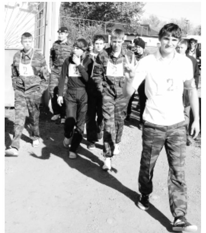
● Почти 300 допризывников приняли участие в легкоатлетическом кроссе.