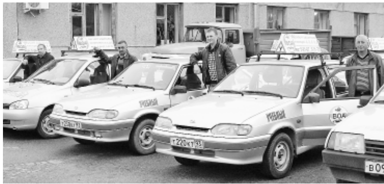
● Автопарк Мостовского ВОА постоянно обновляется. В этом году, к примеру, гараж пополнился новенькой иномаркой.

Компьютеризированные курсы, современные автомобили и возможность проходить обучение по индивидуальной программе делают нашу автошколу одной из лучших в крае. Мостовское ВОА продолжает лучшие традиции автошколы и готовит водителей всех категорий. Автопарк постоянно обновляется. В этом году, к примеру, гараж пополнился новенькой иномаркой. Всего же автопарк школы насчитывает 12 легковых, четыре грузовых автомобиля, мотоцикл и автобус.