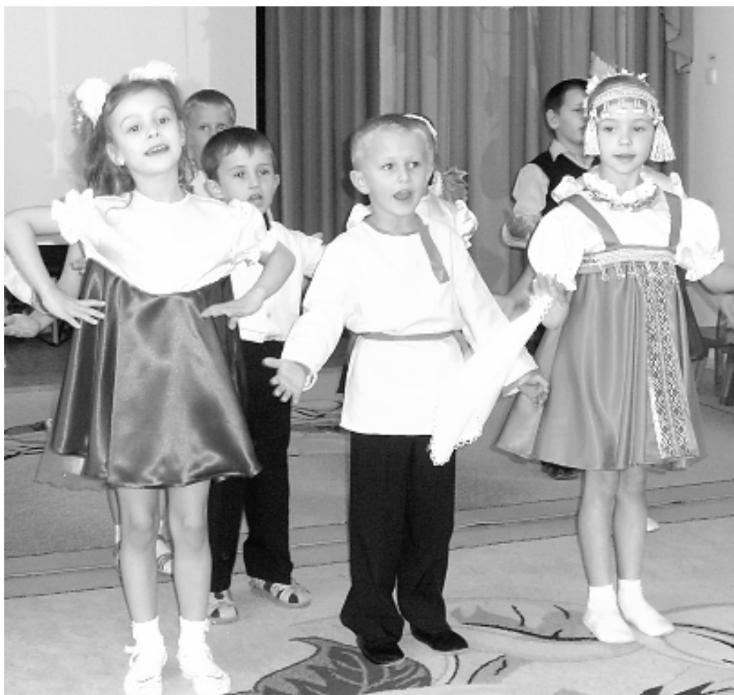
● Гостию форума приветствуют воспитанники детского сада «Колокольчик»