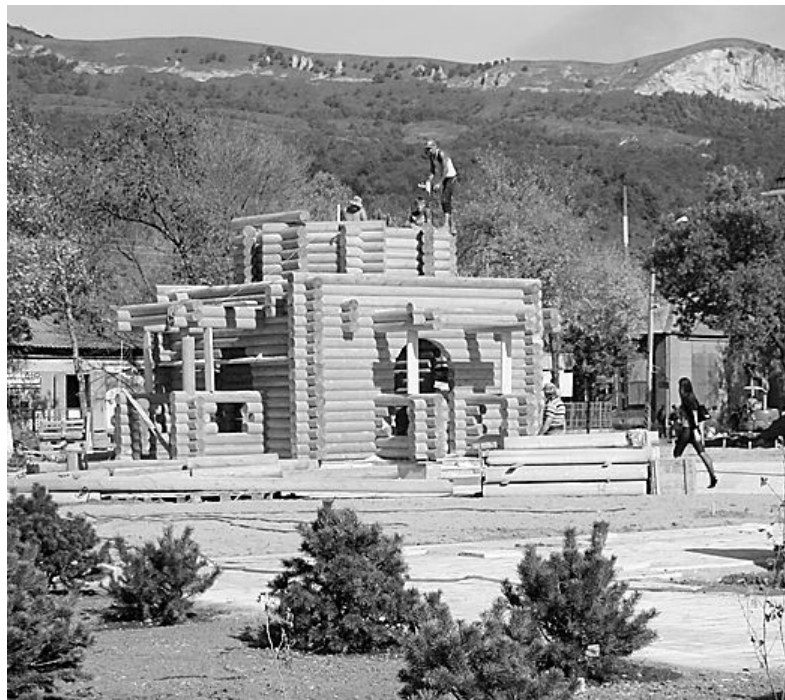
● Новый сквер станет для жителей Псебая местом культурного отдыха.