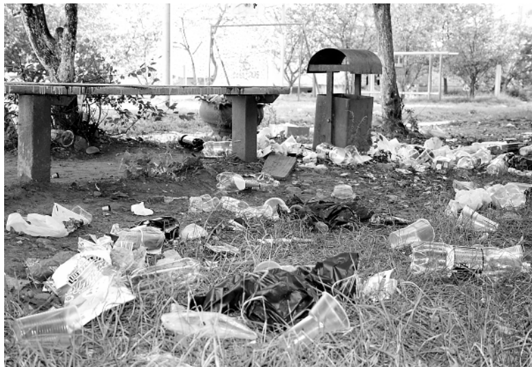
● Так отдыхает молодежь у дома № 117 по ул. Гоголя райцентра.

нец мусор убрали женщины с окрестных домов. Но сейчас здесь вновь стремительно подрастает свалка. «Молодежь...» - говорят женщины.