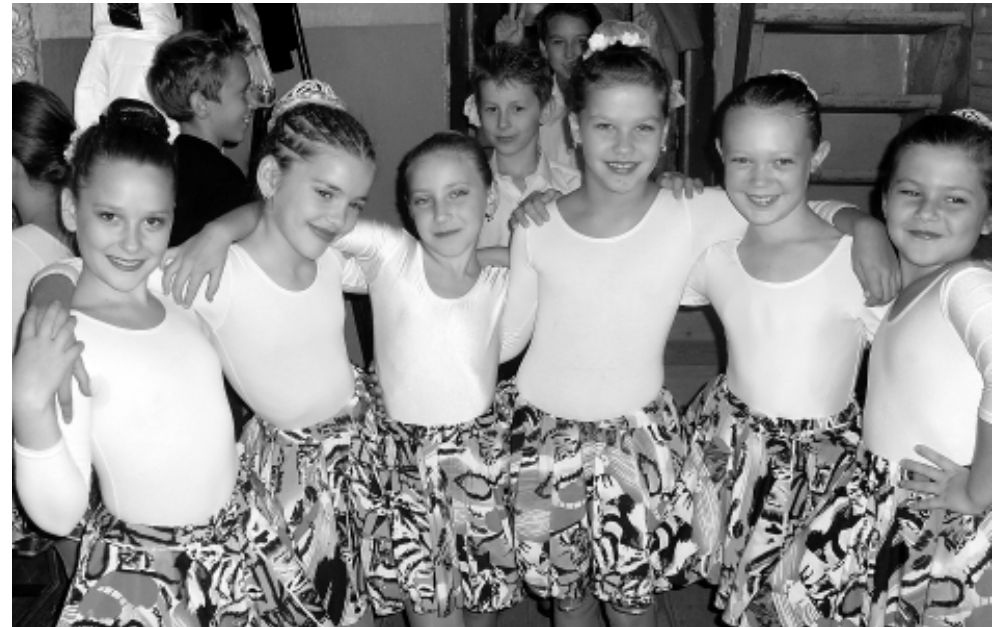
● Зрителей покорила детский псебайский танцевальный коллектив «Джуниор Дэнс».

Конечно, в торжественный момент не могли не отметить и тех, кто своей активной