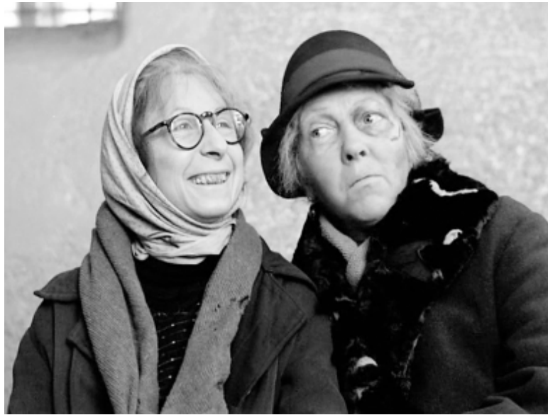
● Кадр из фильма «Небеса обетованные».

Вывод третий. инопланетян нам не дожидаться. Довелось мне посмотреть два фильма. Один - про сладкую жизнь американских пенсионеров, другой - про нашу жизнь. В американском фильме пенсионеры живут, не побоюсь этого слова, в