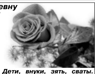
Дети, внуки, зять, сваты.

С днем рождения поздравляем И от всей души желаем Счастья, радости, добра, Быть веселою всегда, Что задумала - исполнить, Жизнь прекрасна - это помнить, Улыбаться, долго жить, Людям радость приносить!